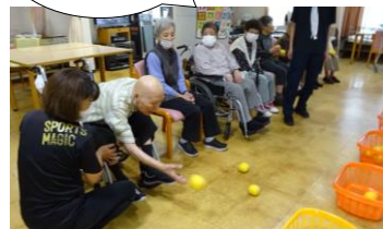
プログラム3 玉入れ