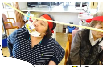
プログラム4 おやつとり競争