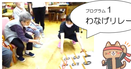
プログラム1 わなげりレー